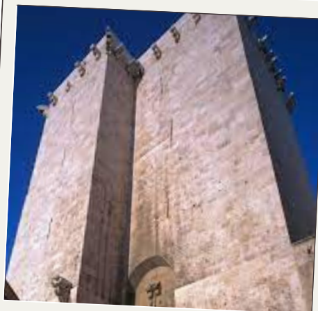
S'AVANZADA E SAN PANCRAZIO