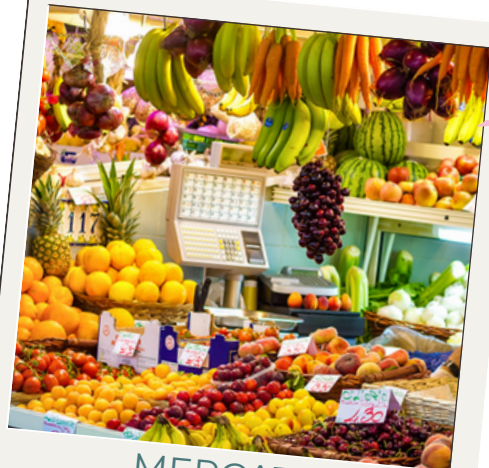
MERCATO DI SAN BENEDETTO